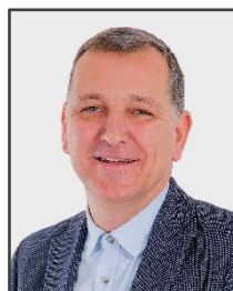
2. Vizebürgermeister Gernot Lichtenegger

→ Die Gemeinderätinnen und Gemeinderäte vertreten die Interessen der Menschen in Riegersburg und werden von ihnen gewählt .