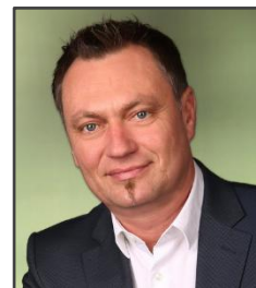
Bürgermeister Manfred Reisenhofer

→ Der 1. Vizebürgermeister und der 2. Vizebürgermeister vertreten ihn .